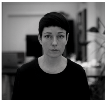
Helle er selvstændig i København

"Jeg er glad for at være selvstændig, men vi har færre rettigheder end de fastansatte. Så når jeg er på arbejde, har jeg ikke de samme vilkår, som alle andre. Kampen for basale rettigheder for alle, går på tværs af grænser. Derfor tror jeg det er en vigtig kamp at tage - også i EU"